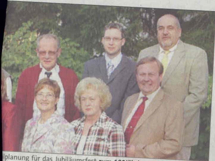
Planung für das Jubiläumfest zum 100jährigen der SPD-Wickede.

Die Eröffnung der Ausstellung findet am 4. November im Rahmen des Benefizabends der Stiftung für Kinder- und Jugendarbeit der ev. Kirchengemeinde Hösel statt, an dem auch ein von den Künstlern gestiftetes Bild zugunsten der Kinder- und Jugendstiftung versteigert wird. Zu sehen sein werden die Werke bis zum 11. November im Foyer des Gemeindehauses der ev. Kirchengemeinde, Bahnhofstraße, in Ratingen.