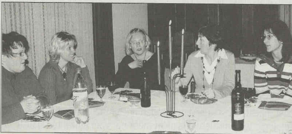
Das Ehrenamt honorieren: Dankeschönabend bei der kfd. ■ Foto: Hüthenbrink

der Gas-Kunden in Wickede. Viel zu teuer seien die Stadtwerke Fröndenberg, hieß es, ob man nicht wechseln könne. Bürgermeister Arndt ist jetzt, die Wogen zu glätten. Schließlich gehört das Gasnetz ja sogar der Gemeinde. Kein Wunder, das einige Kritiker hinterfragte, was denn Wickedes Spitzenpolitiker als Mitglieder des Aufsichtsrates der Gemeindewerke wohl so bekommen...“ ■ in